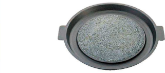
② 長水 フッ素 ストーン焼肉プレート〈QYK-31〉

肉のうまみを逃がさずジューシーに仕上げます。天然石プレート使用により、保温性が良く、焼きムラがなく、均一加熱で、柔らかく仕上げます。