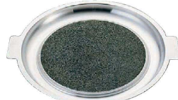
③ 長水 アルミストーン焼肉プレート〈QYK-30〉