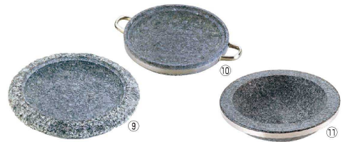
⑨ 長水 石焼 フリーシェイプ 煮込み鍋

キムチチゲ、海鮮鍋、しゃぶしゃぶ、すき焼きから湯豆腐まで…。 石鍋は素材そのものの味を際立たせます。