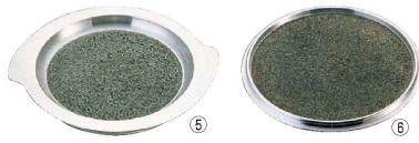
⑤ アルミ枠付 長水石焼S型プレート〈QIS-18〉