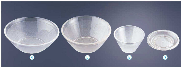
冷麺鉢 (ポリカーボネイト) ④ 大 〈QLI-06〉 9-2146-0401 ¥1,550 φ199×H63 ⑤ 中 〈QLI-07〉 9-2146-0501 ¥1,270 φ163×H62 ⑥ 小 (タレ入れ) 〈QLI-08〉 9-2146-0601 ¥750 φ103×H61 ⑦ 薬味入れ 〈QLI-09〉 9-2146-0701 ¥360 φ105×H10