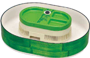
⑪ 家庭用 流しソーめん 竹取物語 16343 〈QSC-18〉 9-2146-1101 ¥6,000 410×310×H120 電源:単1乾電池×2 (別売) ●スイッチを入れると容器の中の水が回ります。