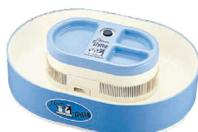
⑫ 家庭用流しソーめん器 コンパクトソーめん ぺんぎん 14923 〈QSC-14〉 9-2146-1201 ¥6,000 415×310×H110 電源:単1乾電池×2 (別売) ●スイッチを入れると容器の中の水が回ります。