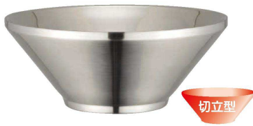
① 18-8 二重ラーメン丼 切立型 〈RLC-D2〉 9-2146-0101 ¥6,300 φ215×H85 1,400c.c. 質量:約360g ●ラーメンやスープなどの熱いお料理はもちろん、冷麺などの冷たいお料理にも最適です。