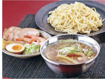
●二重ラーメン丼・メラミン・陶器温度比較(当社調べ)