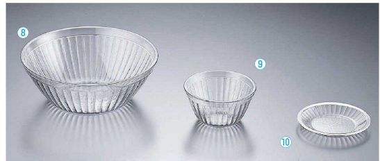
⑧ トウィンクル ソーメン鉢 〈QSC-05〉 9-2146-0801 PC-101 大 ¥1,390 φ198×H70 1,280c.c. 9-2146-0802 PC-102 小 ¥1,250 φ168×H71 880c.c. ⑨ トウィンクル ダシ入れ PC-103 〈QDS-04〉 9-2146-0901 ¥610 φ103×H54 240c.c. ⑩ トウィンクル 薬味皿 PC-104 〈QYK-34〉 9-2146-1001 ¥400 φ104×H13 ●自動洗浄機・高温消毒も可能です。