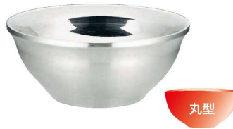
② 18-8 二重丼丸型 小 〈RDV-C5〉 9-2146-0201 ¥4,900 φ160×H70 600c.c. 質量:約160g ●二重中空構造で外側が熱くなりにくいので、お子様用食器として安心して使用できます。 ●保温性があり冷めにくいので、つけ麺のスープ用としても最適です。 ●サイドメニューにも使いやすいサイズです。