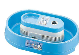
⑬ 家庭用流しソーめん器 ミニ流しソーめん クール 15317 〈QSC-15〉 9-2146-1301 ¥4,000 355×248×H108 電源:単2乾電池×2 (別売) ●スイッチを入れると容器の中の水が回ります。