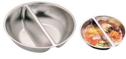
③ 18-8 ダブル冷麺器 SLW-24 〈QLI-10〉 9-2146-0301 ¥4,200 外径 内径 深さ φ kg 9-2146-0301 240 225×60 0.65×2 0.41 ●2種類の麺類・スープ・カレー・ご飯ものなど幅広くご使用いただけます。