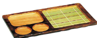
④ 焼杉 天ざる