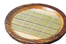
③ 焼杉 盆ざる N-81

(QBV-11) 9-2148-0201 ¥6,390 φ240×H25 ※写真のチョコと薬味入れは別売です。 (P.2149⑬⑭を参照ください。)