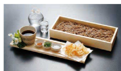
⑫ 桧箱そばセット NB-204

9-2148-1101 大・足付 21438 345×185×H50 ¥7,200 9-2148-1102 小 21436 322×182×H38 ¥6,080