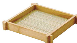
⑮ スス そば盛 スタッキング型

9-2148-1401 8寸 φ240×H25 ¥3,600 9-2148-1402 7寸 φ210×H25 ¥3,400 9-2148-1403 6寸 φ180×H25 ¥3,050