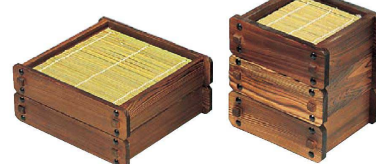
⑬ ネスコ 角セイロ (QKK-12)

(QHK-33) 9-2148-1201 ¥15,500 材質: 木 ウレタン塗装 本体/320×135×H55 盛皿/380×100×H20 竹ス/298×113 ●単品のそばメニューはもちろん、竹すだれを取り、盛皿、盛合、お料理箱として活用できます。