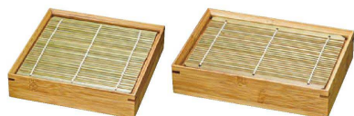
① 竹製 炭化麺皿 (EKT-77)

9-2148-0101 正角 180×180×H47 ¥4,000 9-2148-0102 長角 185×125×H47 ¥3,800