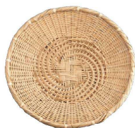
⑭ 白竹 そばザル (QZL-16)

9-2148-1301 大 200×200×H50 ¥4,900 9-2148-1302 小 145×145×H60 ¥4,000