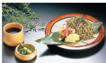
② 杉 盆ざる

9-2148-0101 正角 180×180×H47 ¥4,000 9-2148-0102 長角 185×125×H47 ¥3,800