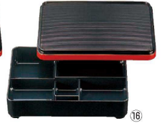
⑯ △ 8.5寸長手舞子弁当 黒淵朱内黒 (RBV-J3) W 9-2156-1601 ¥2,550 257×203×H63