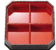
△ 縁高弁当用仕切 ⑩ 黒 (RFK-T0) W 9-2156-1001 ¥750 ⑪ 朱 (RFK-T1) W 9-2156-1101 ¥750 155×77×H39