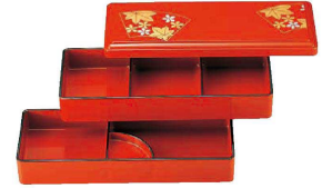
③ △ 立山弁当 朱春秋 (RFK-U0) W 9-2156-0301 蓋 ¥1,400 340×140×H23 9-2156-0302 ツツ切親 ¥1,750 330×128×H50 9-2156-0303 タレ付親 ¥1,800 330×128×H50