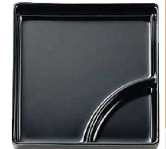
⑦ △ 5寸松花堂用仕切 (RBV-80) W 9-2156-0701 朱 140×140×H23 ¥1,350 9-2156-0702 黒 140×140×H23 ¥1,100