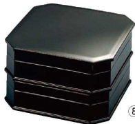
⑧ △ 縁高弁当 黒内朱 (RFK-S8) W 9-2156-0801 蓋 172×172×H10 ¥1,050 9-2156-0802 親 172×172×H58 ¥1,450