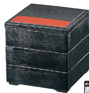
⑥ △ 5寸木目松花堂 黒天朱 (仕切別) (RBV-79) W 9-2156-0601 1段 150×150×H 61 ¥1,500 9-2156-0602 2段 150×150×H103 ¥2,300 9-2156-0603 3段 150×150×H145 ¥3,100 ※⑦の仕切と合わせて御使用ください。