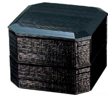
④ △ 5.5寸 ヘギ目縁高重 黒 (RFK-T8) W 9-2156-0401 蓋 153×153×H12 ¥800 9-2156-0402 親 153×153×H41 ¥1,050