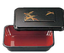
⑭ △ 6寸 主食入れ パール笹 (RBV-A7) W 9-2156-1401 ¥1,550 174×124×H48