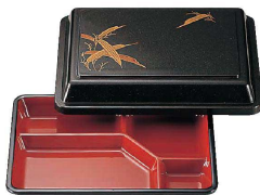
⑬ △ 7寸 副食入れ パール笹 (RBV-A6) W 9-2156-1301 ¥1,900 215×166×H50