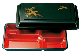
⑫ △ 8寸 副食入 パール笹 (RFK-S3) W 9-2156-1201 ¥2,450 254×170×H50

△ ABS樹脂・熱可塑性樹脂 (耐熱温度約60℃ 洗浄機不可) 耐久性に優れ衝撃に強く割れにくい。塗料の密着も良好。