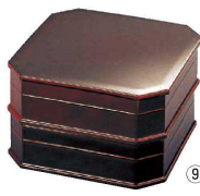
⑨ △ 縁高弁当 チーク内黒 (RFK-S9) W 9-2156-0901 蓋 172×172×H10 ¥1,200 9-2156-0902 親 172×172×H58 ¥1,550