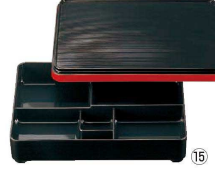
⑮ △ 9.5寸長手舞子弁当 黒淵朱内黒 (RBV-J4) W 9-2156-1501 ¥2,900 285×223×H63