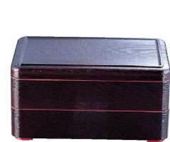
① △ 二段江戸弁当 仕切付 溜 YB-MN2 (RKB-X8) 9-2156-0101 ¥3,300 175×122×H88 耐熱温度:75℃