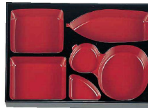
⑩ △△ 尺3寸千筋松花堂用 DX仕切 朱天黒 (RBV-40) 目 9-2158-1001 ¥1,700 360×242×H39