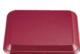
① MT△ C-7アクティブ弁当 ワイン内黒 (RBV-B9) 目 9-2158-0101 ¥5,350 303×273×H58 ●商品は箱のみです。中仕切は②をご 使用ください。(別売)

△ ABS樹脂・熱可塑性樹脂 (耐熱温度約60℃ 洗浄機不可) △TA耐熱ABS樹脂 (耐熱温度約100℃ 洗浄機使用可能) △MT極耐熱ABS樹脂 (耐熱温度約110℃ 洗浄機使用可能) 耐久性に優れ衝撃に強く割れにくい。塗料の密着も良好。 最高グレードのABS樹脂。消毒保管庫にも対応。