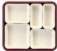
② TA△ C-7アクティブ弁当 中仕切Aセット (RBV-C0) 目 9-2158-0201 ¥2,430 セット内容 No.2 133×66×H38 2個 No.3 133×105×H38 2個 No.4 133×133×H38 1個 材質:ポリプロピレン