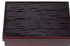
⑬ △△ 尺1寸長手へギ目松花堂 溜 (仕切別) (RBV-44) 目 9-2158-1301 ¥3,150 313×260×H68