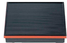
⑮ △△ 尺1寸長手千筋松花堂 黒淵朱 (仕切別) (RBV-46) 目 9-2158-1501 ¥3,200 313×260×H66