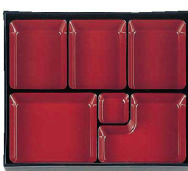
⑰ △△ 尺1寸長手へギ目松花堂用 6ツ仕切 朱天黒 (RBV-48) 目 9-2158-1701 ¥1,450 291×236×H35