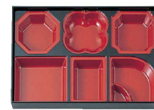
⑪ △△ ニュー尺3寸松花堂用 DX懐石仕切 朱天黒 (RBV-41) 目 9-2158-1101 ¥1,900 358×241×H40

尺1寸松花堂 ⑫~⑮の箱と⑯~⑲の仕切はどのタイプも組み合わせ可能です。お好みの組み合わせをお選びください。