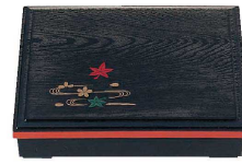
⑭ △△ 尺1寸長手木目松花堂 黒淵朱春秋 (仕切別) (RBV-45) 目 9-2158-1401 ¥3,400 315×260×H70