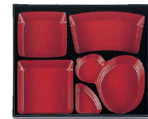
⑲ △△ 尺1寸長手御膳松花堂用 ひざご仕切 朱天黒 (RBV-54) 目 9-2158-1901 ¥1,700 291×236×H39