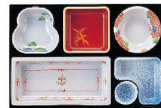
⑨ TA△ 尺3寸長手 B-1光彩仕切 FR塗 (RBV-39) 目 9-2158-0901 ¥4,300 360×241×H36