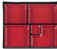
⑱ △△ 尺1寸長手布目松花堂用 5ツ仕切 朱天黒 (RBV-49) 目 9-2158-1801 ¥1,500 291×236×H37