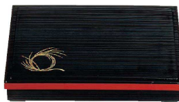
⑦ △△ 尺3寸長手千筋松花堂 柳結び内黒塗 (仕切別) (RBV-37) 目 9-2158-0701 ¥4,800 380×263×H65