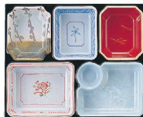
⑯ TA△ 尺1寸長手 A-1光彩仕切 FR塗 (RBV-47) 目 9-2158-1601 ¥3,500 290×236×H35