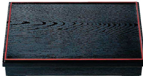
⑥ △△ ニュー尺3寸長手木目 松花堂 黒天朱 (仕切別) (RBV-36) 目 9-2158-0601 ¥3,500 385×265×H65

尺3寸松花堂 ⑥~⑧の箱と⑨~⑪の仕切はどのタイプも組み合わせ可能です。お好みの組み合わせをお選びください。