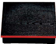
7 木目 8.5寸 木目松花堂 黒淵朱 (仕切別) (RFI-63) W 9-2160-0701 内塗無 ¥1,750 9-2160-0702 内塗品 ¥1,850 260×260×H65

8.5寸 松花堂シリーズ ※箱と仕切はそれぞれ別売です。お好みに合わせてお選び下さい。