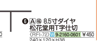
6 ダイヤ 8.5寸ダイヤ 松花堂用T字仕切 (RFI-72) W 9-2160-0601 ¥450 240×120×H38

8.5寸 松花堂シリーズ ※箱と仕切はそれぞれ別売です。お好みに合わせてお選び下さい。