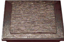
2 ダイヤ 8.5寸 ダイヤ松花堂 新溜 (仕切別) (RFI-B8) W 9-2160-0201 ¥2,400 270×270×H65