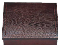
8 木目 8.5寸 木目松花堂 溜内黒 (仕切別) (RFI-64) W 9-2160-0801 ¥2,300 260×260×H65