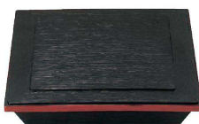
1 ダイヤ 8.5寸 ダイヤ松花堂 黒淵朱 (仕切別) (RFI-B7) W 9-2160-0101 ¥2,400 270×270×H65

従来品と比べ半分の高さ(親3個の場合)で収納ができます。従来品20段の場合の高さは約100cmですがダイヤ松花堂なら約45cmとコンパクトになります。