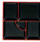
10 幕内仕切 8.5寸松花堂用 幕内仕切 黒天朱 (RFI-C9) W 9-2160-1001 ¥1,200 237×237×H38