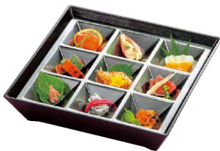
13 舟型仕切 8.5寸松花堂用 舟型仕切 朱天黒 (RFI-78) W 9-2160-1301 ¥1,500 235×235×H35