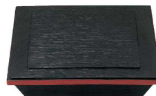
3 超耐熱 8.5寸超耐熱ダイヤ 松花堂 黒淵朱 (仕切別) (RFI-69) W 9-2160-0301 蓋のみ 270×270×H14 ¥2,250 9-2160-0302 親のみ 255×255×H56 ¥3,200