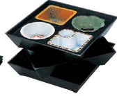
※盛り付け時の 積み重ね例