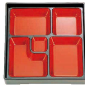
9 DX幕内 8.5寸松花堂用 DX幕内仕切 朱天黒 (RFI-C8) W 9-2160-0901 ¥1,100 235×235×H40