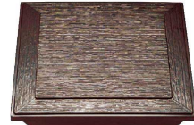
4 超耐熱 8.5寸超耐熱ダイヤ 松花堂 新溜 (仕切別) (RFI-70) W 9-2160-0401 蓋のみ 270×270×H14 ¥2,300 9-2160-0402 親のみ 255×255×H56 ¥3,200