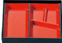
⑦ 9寸松花堂用 A仕切 朱天黒 <RFI-86> W 9-2161-0701 ¥1,100 254×194×H35