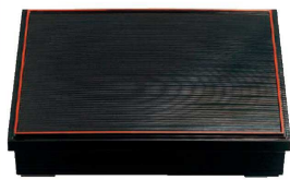
⑩ 尺1乱筋松花堂 黒天朱 (仕切別) <RFI-89> W 9-2161-1001 ¥2,950 313×260×H68