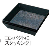
③ 7.5寸松花堂 プレート 朱天黒 <RFI-82> W 9-2161-0301 ABS製 ¥1,200 9-2161-0302 超耐熱ABS製 ¥1,600 202×202×H34