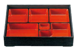
⑫ 尺1松花堂六ツ切 幕の内仕切 <RFI-92> W 9-2161-1201 ¥1,450 290×236×H34