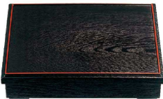
⑤ 9寸木目松花堂 黒天朱 (仕切別) <RFI-83> W 9-2161-0501 ¥2,000 272×212×H61