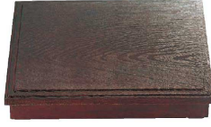
⑮ 尺2長手木目 松花堂 溜内黒 (仕切別) <RFI-95> W 9-2161-1501 ¥4,400 362×273×H69