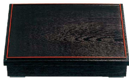
⑪ 尺1木目松花堂 黒天朱 (仕切別) <RFI-90> W 9-2161-1101 ¥3,000 313×260×H68