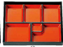
⑰ 尺2松花堂用 幕の内仕切 朱天黒 <RFI-A1> W 9-2161-1701 ¥2,150 337×248×H35