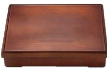
⑥ 9寸千筋松花堂 ブラウン (仕切別) <RSU-28> W 9-2161-0601 ¥3,200 272×212×H65