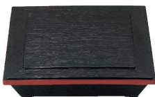
① 7.5寸ダイヤ松花堂 黒天朱 (仕切別) <RFI-80> W 9-2161-0101 ABS製 ¥2,300 9-2161-0102 超耐熱ABS製 ¥3,800 232×232×H62

△ ABS樹脂・熱可塑性樹脂 (耐熱温度約60℃ 洗浄機不可) 耐久性に優れ衝撃に強く割れにくい。塗料の密着も良好。 超耐熱ABS樹脂 (耐熱温度約120℃ 洗浄機使用可能) 耐久性に優れ衝撃に強く割れにくい。塗料の密着も良好。