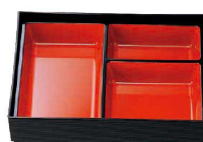
⑧ 9寸松花堂用 B仕切 朱天黒 <RFI-87> W 9-2161-0801 ¥1,100 254×194×H36