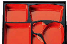
⑭ 尺1DX長手弁当用 ひさご仕切 朱天黒 <RFI-93> W 9-2161-1401 ¥1,750 289×229×H42