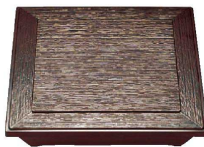
② 7.5寸ダイヤ松花堂 新溜 (仕切別) <RFI-81> W 9-2161-0201 ABS製 ¥2,400 9-2161-0202 超耐熱ABS製 ¥3,800 232×232×H62