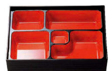
⑨ 9寸松花堂用 幕の内仕切 朱天黒 <RFI-85> W 9-2161-0901 ¥1,050 254×194×H40