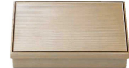
⑬ 尺1千筋松花堂 銀天溜内黒 (仕切別) <RSU-29> W 9-2161-1301 ¥5,500 310×248×H65