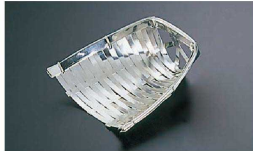
③ 箕盛皿 90664B (QML-54) 9-2173-0301 ¥3,700 110×107