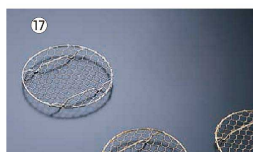
⑰ 18-8 足付銀司 (QGV-28) 9-2173-1701 ¥1,500 φ115×H12