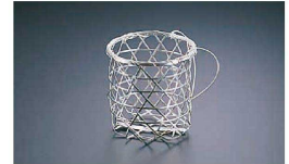
⑥ 背おい籠 90672B (QKG-12) 9-2173-0601 ¥3,500 φ85×H80