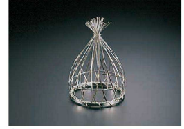
① 六ツ目 かまくら型 90662B (QKM-55) 9-2173-0101 ¥3,800 φ95×H140