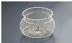
⑬ 魚籠 90687B (QKG-16) 9-2173-1301 ¥6,200 φ125×H85