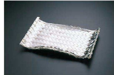
⑤ アジロ 角盛皿 小 90678B (QML-57) 9-2173-0501 ¥8,400 193×H140