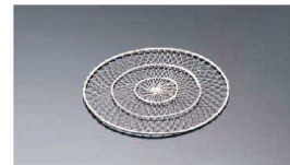
⑯ ぎんす 足なし 16cm (QGV-20) 9-2173-1601 ¥2,300 φ155