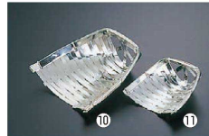
⑩ 箕 銘々皿 大 90677B (QMI-03) 9-2173-1001 ¥2,900 95×90