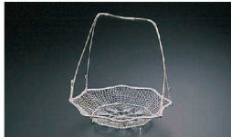
⑦ 亀甲八角盛籠 90696B (QKG-14) 9-2173-0701 ¥6,900 160×155×H185