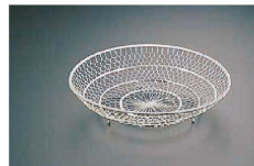
⑮ 六ツ目皿 L 90685B (QSL-09) 9-2173-1501 ¥5,200 φ165×H35