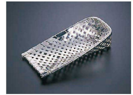
② 長箕盛皿 90665B (QML-55) 9-2173-0201 ¥5,500 100×175