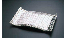
④ アジロ 角盛皿 大 90679B (QML-56) 9-2173-0401 ¥9,400 228×H156