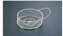
⑫ 七瀬籠 90693B (QKG-17) 9-2173-1201 ¥4,600 φ110×140×H50