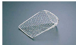
⑭ 箕皿 90690B (QSL-07) 9-2173-1401 ¥3,300 85×100×H35