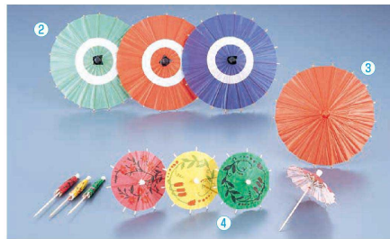
クラフトPOP 料理演出小物 さりげない美しさで料理をひきたてる