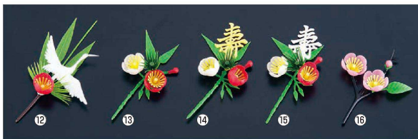
プリティフラワー