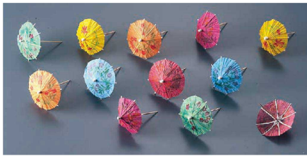
① 傘楊枝 SK-024 (144本入) 入販 〈QYU-10〉 9-2176-0101 全長:100 ¥7,500