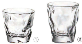
① ロック S130 (2ヶ入)

〈RJB-93〉 9-2204-0101 ¥5,500 φ97(内口径φ85)×H90 265c.c.