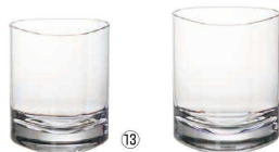
⑬ ロック S116 (2ヶ入)

〈RJB-A5〉 9-2204-1301 ¥4,100 73×73(内口径68×68)×H90 245c.c.