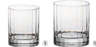
⑨ ロック S101 (2ヶ入)

〈RJB-A0〉 9-2204-0801 ¥6,100 φ89(内口径φ77)×H109 305c.c.