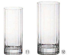
⑪ トール S103 (2ヶ入)

〈RJB-A2〉 9-2204-1001 ¥5,250 φ86(内口径φ82)×H97 380c.c.