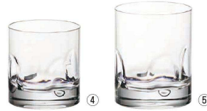
④ ロック S124 (2ヶ入)

〈RJB-95〉 9-2204-0301 ¥4,600 φ73(内口径φ69)×H156 375c.c.