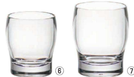
⑥ ロック S022 (2ヶ入)

〈RJB-98〉 9-2204-0601 ¥4,600 φ79(内口径φ70)×H92 235c.c.