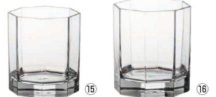
⑮ ロック S105 (2ヶ入)

〈RJB-A6〉 9-2204-1401 ¥4,600 79×79(内口径73×73)×H98 320c.c.