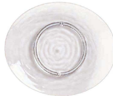
⑫ ハンドルトレイ No.92393 〈RTR-38〉 9-2208-1201 ¥11,500 φ356×H42