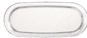
⑦ アペタイザープラター No.92399 〈RTR-36〉 9-2208-0701 ¥4,550 419×178×H29