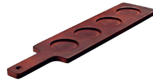
② リビー 木製 飲み比べ用サービングボード No.96381

9-2238-0101 No.A96458 マットブラック ¥6,500 9-2238-0102 No.A96459 チェリーウッド ¥7,300 476×105×H35 穴径:57 材質:メラミン