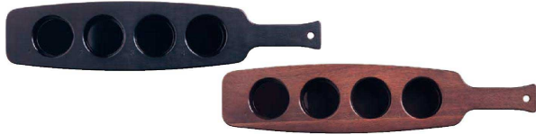
① リビー 飲み比べ用サービングボード 〈RLI-98〉

9-2238-0101 No.A96458 マットブラック ¥6,500 9-2238-0102 No.A96459 チェリーウッド ¥7,300 476×105×H35 穴径:57 材質:メラミン