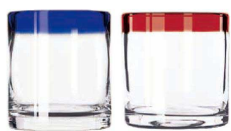
⑨ ロック(6ヶ入) 〈PLB-B4〉 ¥15,000 9-2242-0901 No.92302 ブルー 9-2242-0902 No.92302R レッド φ86(口径86)×H92 355c.c.