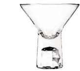
① ショット No.2779VCL13(6ヶ入) 〈PLB-A9〉 9-2242-0101 ¥8,400 φ99(口径99)×H94 150c.c.