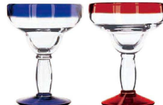
⑫ マルガリータ(6ヶ入) 〈PLB-B7〉 9-2242-1201 No.92308 ブルー ¥24,000 9-2242-1202 No.92308R レッド ¥24,600 φ118(口径118)×H162 355c.c.