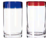
⑩ クーラー(6ヶ入) 〈PLB-B5〉 ¥16,500 9-2242-1001 No.92303 ブルー 9-2242-1002 No.92303R レッド φ83(口径83)×H143 473c.c.