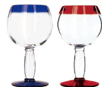
⑬ ラウンドカクテル(6ヶ入) 〈PLB-B8〉 9-2242-1301 No.92309 ブルー ¥22,500 9-2242-1302 No.92309R レッド ¥17,400 φ86(口径86)×H185 473c.c.