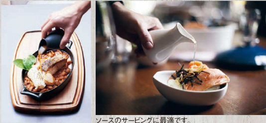
ソースのサービングに最適です。