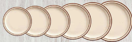
① プレート (RAM-65)