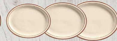
② プラター (RAM-66)