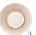
12 トープ フラットプレート 29cm 4021-2795 (インナー14.5cm) 〈RBL-I8〉 9-2318-1201 ¥5,000 φ290×H25