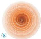
5 レッドサン ビュッフェプレート 32cm 4020-2595 〈RBL-H8〉 9-2318-0501 ¥6,500 φ320×H15