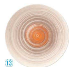
13 トープ フラットプレート 29cm 4021-2621 〈RBL-I4〉 9-2318-1301 ¥5,000 φ290×H30