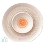
11 レッドサン ディーププレート 29cm 4020-2700 (インナー14cm) 〈RBL-J3〉 9-2318-1101 ¥5,000 φ290×H50