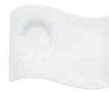
4 パーティープレート 2484-2831 〈RBL-35〉 9-2318-0401 ¥2,500 170×130×H25 ●③ニューウエイブエスプレッソ専用