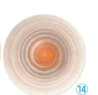
14 トープ フラットプレート 25cm 4021-2630 〈RBL-I5〉 9-2318-1401 ¥3,500 φ250×H25