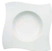
1 ディーププレート 2525-2709 〈RBL-37〉 9-2318-0101 ¥5,500 250×250×H40

一体成型に作成された機能性を重視したアイテムで、「ドイツ技術革新賞」を受賞した技術的にも評価を受けている商品です。