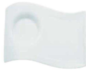
2 カフェパーティー プレート 2484-2830 〈RBL-33〉 9-2318-0201 ¥4,000 220×170×H30