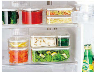
●角型は整然と重ねられます。

材質：本体/ポリカーボネイト 耐熱温度：140℃ パッキン/シリコンゴム 耐熱温度：140℃ ※電子レンジでご使用の際はフタを少しずらしてご使用ください。