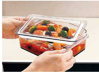
●本体も蓋も透明なので、一目で中身を確認できます。