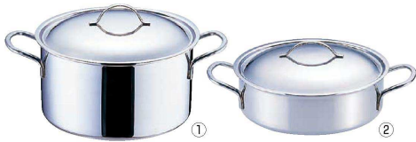
① 18-10 プライオリティ 半寸胴鍋 (蓋付) 3694 (AHV-66)