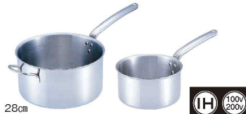
③ 18-10 プライオリティ 片手深型鍋 (蓋無) 3690 (AST-E4)