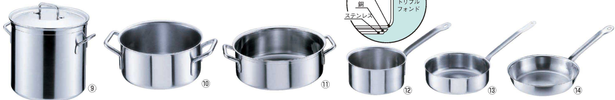
⑨ 18-10 寸胴鍋 三重底 (蓋付) (AZV-09)