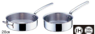
④ 18-10 プライオリティ 片手浅型鍋 (蓋無) 3691 (AST-E5)