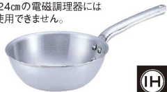
⑤ 18-10 プライオリティ テーパーパン 3692 (AST-E7)

①②底板厚:2.0 ※コイル径φ24cmの電磁調理器には32cmはご使用できません。