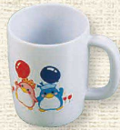
⑩ BB-9 片手コップ (小) 〈RKT-86〉 9-2429-1101 ¥750 φ65×H75 190c.c.