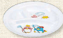
① BB-1 丸ランチ皿 (大) 〈RLV-46〉 9-2429-0101 ¥1,890 φ250×H29