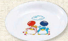
⑯ BB-27 おやつ皿 〈ROY-02〉 9-2429-1701 ¥1,100 φ180×H25