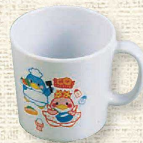
⑪ BB-15 片手コップ (大) 〈RKT-87〉 9-2429-1201 ¥830 φ77×H71 200c.c.