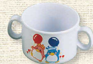
⑫ BB-16 両手コップ 〈RKT-88〉 9-2429-1301 ¥1,190 φ82×H55 220c.c.