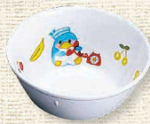
⑱ BB-47 ミルク椀 〈RML-C8〉 9-2429-1901 ¥930 φ114×H50