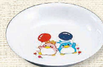
⑮ BB-26 大皿 〈ROO-11〉 9-2429-1601 ¥830 φ150×H30