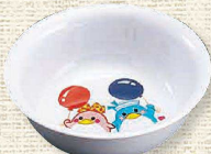
⑰ BB-28 小鉢 〈RKB-C6〉 9-2429-1801 ¥960 φ126×H41 210c.c.