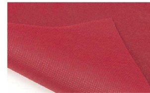
両面使えて経済的。