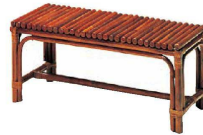
3 藤縁台 SCR-017-T-ED 〈ZEV-10〉 9-2506-0301 ¥39,900 730×350×H340