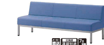
2 ベンチ TTKK-KRPS-E 〈UTU-56〉 9-2506-0201 ¥126,900 1,800×600×H700×座高400 張材:レザー

※このページの商品の返却は御遠慮下さい。 ※①を除くこのページの商品は、メーカーより直送になります。なお御注文の際は在庫確認をお願いします。