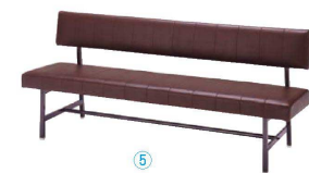
5 ベンチ 〈UBV-14〉 ブラック ブラウン MC-1218 9-2506-0501 9-2506-0502 1,800×520×H730 ¥56,000 MC-1215 9-2506-0503 9-2506-0504 1,500×520×H730 ¥51,000 座高:420 本体:木枠 ウレタンフォーム 脚部:26角パイプ メラミン焼付け塗装 張地:ビニールレザー