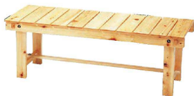
9 白木 縁台 〈ZEV-02〉 9-2506-0901 ¥33,500 1,200×400×H410