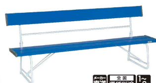
13 折りたたみ式 背付ベンチ 1800 BC-300-018 青 〈UBV-08〉 9-2506-1301 ¥45,500 1,800×516×H740×座高370 材質:座面/硬質塩化ビニール 脚/スチールパイプに粉体塗装 背板縦サイズ:140mm 質量:約16.6kg ●座面両端は安全カバー付