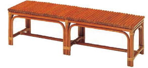
4 藤縁台 SCR-016-T-ED 〈ZEV-15〉 9-2506-0401 ¥54,300 1,200×350×H340