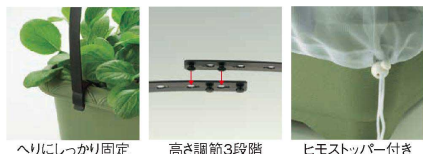
へりにしっかり固定 高さ調節3段階 ヒモストッパー付き

500～655×420×385 材質：ポリプロピレン・ポリエステル・ポリアセタール セット内容：アーチバー×4、防虫ネット ●アーチバーがアジャスター式なので高さを3段階に調節できます。 ※③④にご使用できます。