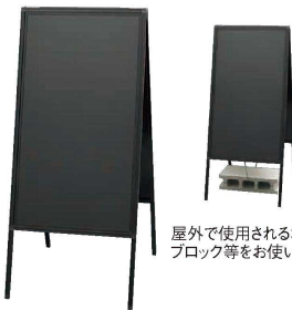
4 蛍光マーカー用アルミ枠 スタンド黒板 ABD85-1 〈PKK-81〉 目 9-2509-0401 ¥16,000 482×600×H1,065 黒板サイズ:430×790