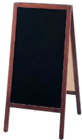
1 マーカー用 スタンド黒板 TBD70-4 〈PKK-86〉 目 9-2509-0101 ¥10,500 520×610×H1,080 黒板サイズ:450×800