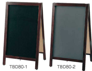
5 黒板スタンド 〈PKK-82〉 目 ¥9,800 9-2509-0501 TBD80-1 マーカー用 9-2509-0502 TBD80-2 チョーク用 500×400×H840 黒板サイズ:430×680