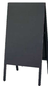
10 チョーク用 スタンド黒板 ビッグタイプ TBD120-1 〈PKK-85〉 目 9-2509-1001 ¥13,000 600×530×H1,200 黒板サイズ:600×950 ●従来型(450×H1,000)より一回り大きい600×H1,200のビッグサイズ。 ●大型店やメニューが沢山あるお店に。