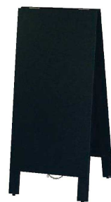
11 チョーク用 木製スタンド黒板 ミニタイプ TBD83-1 〈PKK-83〉 目 9-2509-1101 ¥7,200 360×390×H800 黒板サイズ:360×700 ●場所を取らないミニサイズ