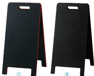
7 ハンド式スタンド黒板 (マーカー・チョーク兼用) 赤枠 HTBD-75 〈PHV-33〉 目 9-2509-0701 ¥7,000