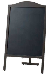
3 マーカー用 木製スタンド黒板 山型 YBD90-1 〈PKK-73〉 目 9-2509-0301 ¥13,000 650×475×H1,110 黒板サイズ:570×770 ●マグネットが使用できます。