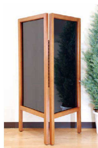
9 V型サインボード 49493 〈YSI-02〉 目 9-2509-0901 ¥13,000 450×50×H1,050(折りたたみ時) ボードサイズ:380×780 ●マーカータイプ ●使い勝手が悪かったコーナーへの設置も可能です。 ●角度を調整する事で効果的にご使用できます。