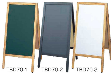
2 スタンド黒板 洋・和風タイプ 〈PKK-62〉 目 ¥10,500 9-2509-0201 TBD70-1 洋風タイプ 9-2509-0202 TBD70-2 和風タイプ 9-2509-0203 TBD70-3 洋風タイプ 520×610×H1,080 TBD70-1 白木タイプ 表:ホワイトボード 裏:緑 TBD70-2 黒塗リタイプ 両面黒板 TBD70-3 白木タイプ 両面ホワイトボード 黒板サイズ:450×810