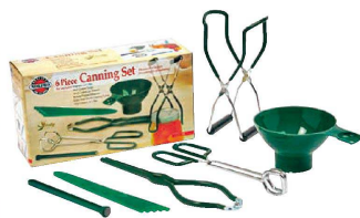
⑤ 瓶詰セット 599 (6PC)

(AKV-U4) 9-0251-0501 ¥4,500 セット内容: トング、リフター、マグネット棒、漏斗、ジャーレンチ、バブルポッパー ●このセット1つで簡単に瓶詰を作ることができます。