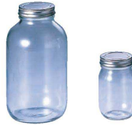
⑥ 18-0 キャップ ガラス保存びん (AHZ-18)

(AKV-U4) 9-0251-0501 ¥4,500 セット内容: トング、リフター、マグネット棒、漏斗、ジャーレンチ、バブルポッパー ●このセット1つで簡単に瓶詰を作ることができます。