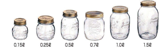
② クアトロスタツジョーニ ジャー (RBR-79)