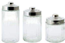
⑦ ガラス キャニスター スクリューリッド CH02-K32 (AKY-42)