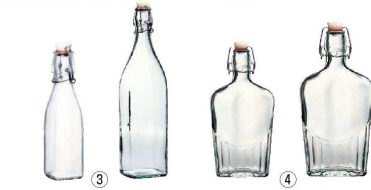
③ スイング ボトル (RBR-51)