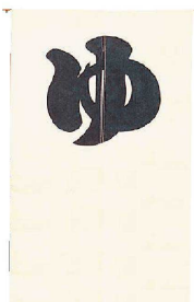
⑧ 半間のれん ゆ 301-07 白 〈YHV-10〉 9-2558-0801 ¥10,000 850×1,400 綿100%