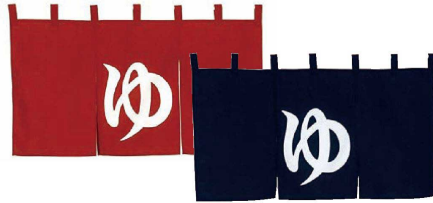
① 半間のれん ゆ N005-020 〈YNL-R6〉 目 ¥8,600 9-2558-0101 1 朱 9-2558-0102 3 紺 850×450 綿85% 麻15%