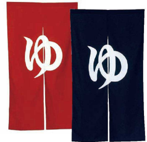
③ 半間のれん ゆ N005-080 〈YNL-R8〉 目 ¥12,000 9-2558-0301 1 朱 9-2558-0302 3 紺 850×1,500 綿85% 麻15%