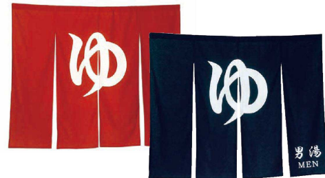
⑤ 1間のれん ゆ N005-120 〈YNL-S0〉 目 ¥20,800 9-2558-0501 1 朱 9-2558-0502 3 紺 1,700×1,400 綿85% 麻15%