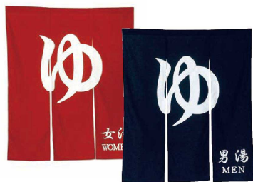
④ 幅広のれん ゆ N005-110 〈YNL-R9〉 目 ¥17,800 9-2558-0401 1 朱 9-2558-0402 3 紺 1,200×1,400 綿85% 麻15%