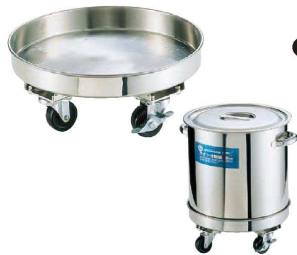
6 18-8寸胴 運搬用台車 (キャストーストッパー付き) (AZV-13)

●スープを作る際に、具材が鍋底に直接触れるのを防ぎ、焦げにくくなります。 ●側面・上部に穴が開いていますので、スープの対流がスムーズになります。