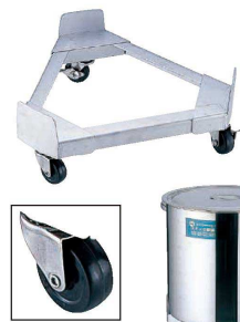
8 18-8 寸胴鍋 運搬用 トライアングルキャリアー(ゴム車) (AZV-68) 目

キャストーストッパー: ナイロンφ100×4 (2輪ストッパー付) ●大型寸胴鍋の使用時の重さに耐えられる高強度設計。