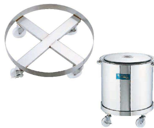
7 18-8 大型寸胴鍋用 運搬台車 (AZV-82) 目