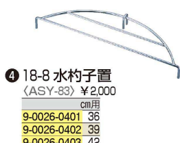
4 18-8 水杓子置 (ASY-83) ¥2,000