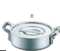
8 エレテック外輪鍋 <AST-11>