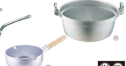
10 エレテック アルミ雪平鍋 <AYK-03>