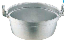
5 エコクリーン アルミ エレテック 円付鍋 (本体内面ゼロクリア2コート加工) <AEK-69>