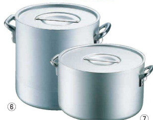
6 エレテック寸胴鍋 <AZV-04>