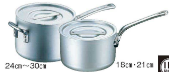
3 エコクリーン アルミ エレテック 片手鍋 (本体内面ゼロクリア2コート加工) <AEK-68>