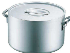
2 エコクリーン アルミ エレテック 半寸胴鍋 (本体内面ゼロクリア2コート加工) <AEK-67>