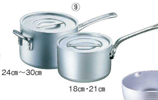
9 エレテック片手鍋 <AKT-01>