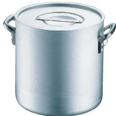
1 エコクリーン アルミ エレテック 寸胴鍋 (本体内面ゼロクリア2コート加工) <AEK-66>