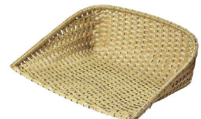
⑫ 樹脂箕 白 (WMN-05) 洗