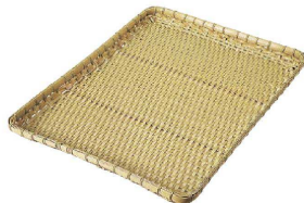
⑩ 樹脂ダンベイ(浅)白 (ATV-59) 洗