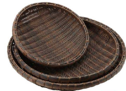
⑥ 樹脂 丸ザル 茶 (AZL-67) 洗