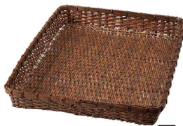
⑧ 樹脂ダンベイ(深)茶 (ATV-62) 洗