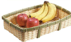
⑤ 樹脂 身竹角長かご 深 (AKG-33) 洗