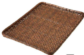
⑦ 樹脂ダンベイ(浅)茶 (ATV-60) 洗