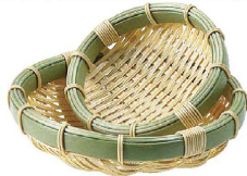
① 樹脂 身竹丸ざる 深 (AZL-70) 洗