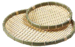
② 樹脂 身竹丸ざる (AZL-68) 洗