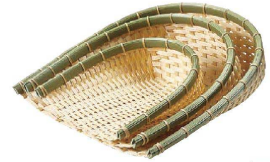
③ 樹脂 身竹箕ざる (AZL-69) 洗