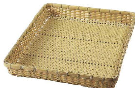
⑪ 樹脂ダンベイ(深)白 (ATV-61) 洗