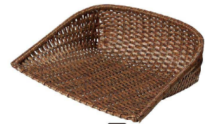
⑨ 樹脂箕 茶 (WMN-06) 洗