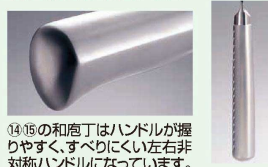
⑭⑮の和庖丁はハンドルが握りやすく、すべりにくい左右非対称ハンドルになっています。