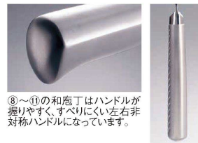
⑧～⑪の和庖丁はハンドルが握りやすく、すべりにくい左右非対称ハンドルになっています。