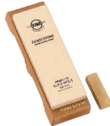
② キングゴールド 最終超仕上砥石 G-1型(#8000) 〈ATI-69〉 9-0348-0201 ¥16,500 210×73×H22 (砥石のみ) ●面直し用名倉砥石付