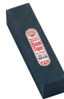
⑬ C角朝日虎印金剛 荒砥石 No.500 2丁掛(#120) 〈ATI-72〉 9-0348-1401 ¥4,500 205×50×H50