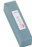
⑨ GC角朝日虎印金剛 荒砥石 2丁掛(#240) 〈ATI-67〉 9-0348-0901 ¥5,300 205×50×H50