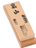
④ 天然砥石 人造嵐山砥石仕上(台付) (#6000) 〈ATI-41〉 9-0348-0401 ¥7,800 仕上:213×74×H24 (砥石のみ)