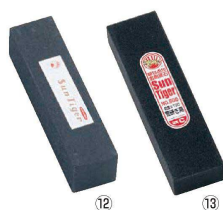
⑫ C角朝日虎印金剛 荒砥石 No.100 2丁掛(#120) 〈ATI-71〉 9-0348-1201 ¥4,600 205×50×H50