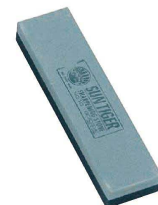
⑮ GC/C コンビ 朝日虎印 荒砥石 No.10(#120/#250) 〈ATI-73〉 9-0348-1501 ¥2,800 205×50×H25