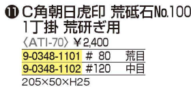
⑪ C角朝日虎印 荒砥石No.100 1丁掛 荒研ぎ用 〈ATI-70〉 ¥2,400 9-0348-1101 # 80 荒目 9-0348-1102 #120 中目 205×50×H25