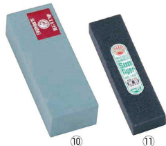
⑩ 赤エビ印 金剛砥石 (No. 400) 〈ATI-09〉 9-0348-1001 ¥9,400 210×78×H52