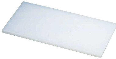
① トンボ プラスチック業務用まな板 (AMN-07) 抗菌