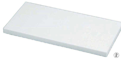
② トンボ 抗菌剤入り業務用まな板(ポリエチレン) (AMN-09) 抗菌