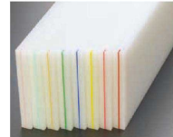
カラー差し込み(Bタイプ) ※カラー部分埋め込みタイプ ピンク・ブルー・ベージュ・グリーン・ 濃ブルー・イエロー・濃ピンク・赤