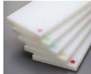
カラーうめ込み(大) φ24mmは表面のみ ピンク・グリーン・ブルー・ ベージュ・赤