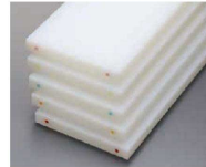
カラーうめ込み(小) φ9mmは側面のみ ピンク・グリーン・ブルー・ ベージュ・赤