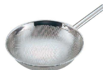
⑪ エコクリーンUK18-8パンチングスクイザル(AEK-22) 目 cm 深さ 柄長 9-0402-1101 24 φ250×70 210 ¥12,900 9-0402-1102 26 φ270×75 210 ¥13,500 9-0402-1103 28 φ285×80 210 ¥14,000 9-0402-1104 30 φ305×85 210 ¥14,600 9-0402-1105 33 φ335×90 210 ¥15,700 パンチング穴径:2.2