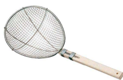
⑦ TSステンレス極荒すくい網スィノ型特大(18-8アミ・2.5メッシュ) (ASK-39) 目 9-0402-0701 ¥5,300 (A)630×(B)280×(C)250×深さ80 ⑥、⑦ 安全性、耐久性に優れた溶接金網を使用。 接点が溶接されている為ほつれません。