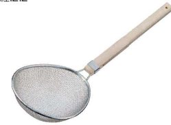
⑤ TSステンレスプロすいこの木柄(18-8アミ・6.5メッシュ)(ASI-69) 目 (A) (B) (C) 深さ 9-0402-0501 特大 631 280 250 77 ¥4,200 9-0402-0502 大 606 255 220 77 ¥3,600 9-0402-0503 中 486 220 190 66 ¥3,100 9-0402-0504 小 456 190 160 49 ¥2,750