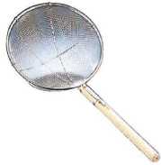
③ 18-8丸型スクイ玉揚(6.5メッシュ) (ASK-10) 9-0402-0301 ¥5,500 (A) (B) (C) 深さ 620 270 270 100