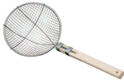
⑥ TSステンレス極荒すくい網丸型(18-8アミ・2.5メッシュ) (ASK-38) 目 9-0402-0601 ¥4,900 φ240×全長590×深さ60