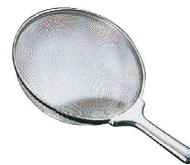
⑧ 18-8ジャンボスクイざる(10メッシュ)(ASK-08) 全長 深さ 9-0402-0801 大 φ400×630×120 ¥19,500 9-0402-0802 小 φ300×500×100 ¥18,000