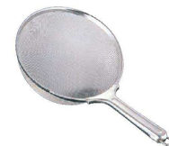
⑫ BK18-8すくいザル(ASK-79) 目 cm 全長 深さ 9-0402-1201 30 φ300×530×118 ¥17,000 9-0402-1202 35 φ350×580×118 ¥18,300 9-0402-1203 40 φ400×630×118 ¥19,500 ●強度を高める構造で変形にくい丈夫なフレームです。