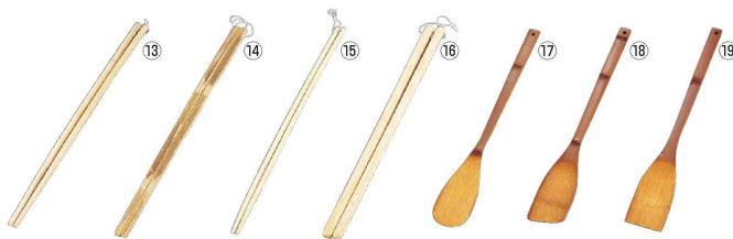
⑬ 竹製 麺箸 全長:540 (AMV-02) 9-0402-1301 ¥950 ⑭ 竹製 ゆで箸 全長:550 (AYD-04) 9-0402-1401 ¥1,500 ⑮ 竹製 丸菜箸 全長:540 (AML-13) 9-0402-1501 ¥1,550 ⑯ 竹製 めん箸 26-206 (AMV-27) 9-0402-1601 ¥1,720 全長:555 ●太さがあるので、うどんなど大きい釜で麺を茹でる時に最適です。