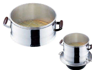
⑧ アルミ 長生セイロ(羽釜用) (ASI-73) 目

※木蓋は板セイロより1サイズ大きいサイズを御使用ください。(P.39を御参照ください。) ※スタレは⑥和セイロと共通ですが、1サイズ大きいサイズを御使用下さい。 材質:桧製