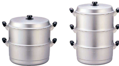
⑤ アルマイト スチームクッカー (AST-09) 目