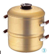
③ アルミキャスト IH ベストセイロセット (ASI-91) 目