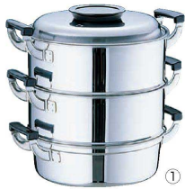
① 桃印18-0 丸型蒸器 (AMS-72)