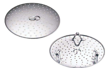
⑨ フライパン用 蒸し調理皿 (AMS-08)