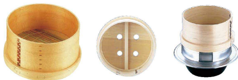
⑦ 板セイロ(羽釜用)(スタレ付) (ASI-10)

※木蓋は和セイロと同じサイズを御使用ください。(P.39を御参照ください。) 材質:桧製