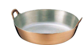
⑥ Ω銅 揚鍋 (AAG-08)