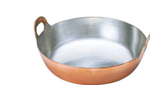
⑤ Ω銅 揚鍋 (楕目入り) (AAG-53)