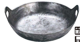
⑩ 大和 鉄イモノ 揚鍋 (AAG-27)