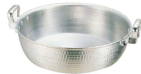
⑧ アルミ DON打出 揚鍋 (AAG-11) □