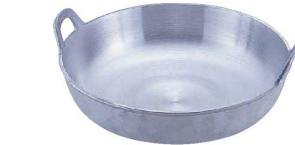
⑨ アルミ イモノ揚鍋 (AAG-12)