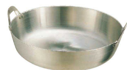
⑦ 18-8 揚鍋 (AAG-15)