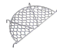
⑫ Ω18-8 亀甲目 半月型 天ぷらアミ (ATV-03)