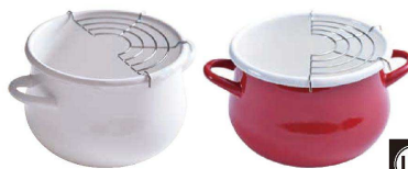
⑧ コーゼークック ホーロー ミニ天ぶら鍋 16cm