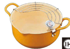
⑥ カラッフル揚げ鍋 20cm