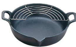
⑤ 岩鑄 鉄 天ぶら鍋 平底