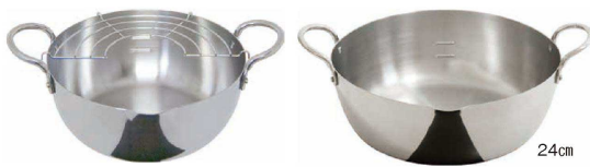
⑩ ステンレス揚げ鍋 (AAG-51) 目