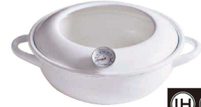
⑨ コーゼークック ホーロー 天ぶら鍋(温度計付き) 23cm