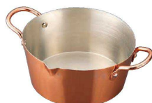
⑦ からっと銅のあげなべ