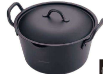
③ IH 鉄 たっぶり深型揚げ鍋 20cm(蓋付)