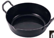
② 鉄 本格揚げ鍋 24cm