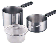
⑪ 18-0 あげもの名人