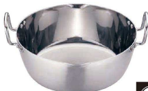
② クラッド鋼 両手雪平鍋 (AYK-69)