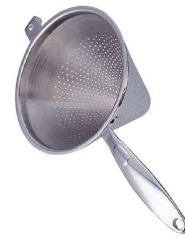
⑧ UK18-8片手コランダール (モナカハンドル) <AKL-16>