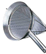
⑥ 弁慶 18-8 スープ漉し (杉綾織り) 普通目 (30メッシュ) <BSC-03>