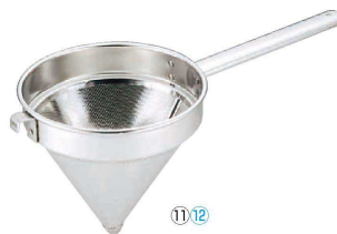
⑪ UK 18-8 スープ漉し <BSC-05>