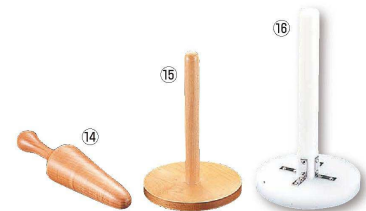
⑭ Ω 木製 スープ押し棒 <BSC-06> 9-0442-1401 ¥14,000