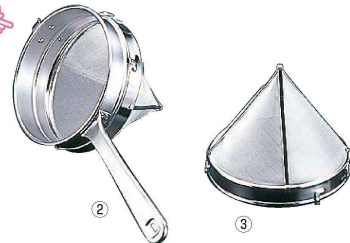
② Ω 18-8 ワンタッチ スープ漉しセット <BSC-01> ¥14,100