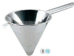
⑨ UK18-8 パンチング スープ漉し <BSC-35>