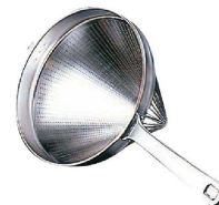
⑦ 18-8 スープ漉し 27cm <BSC-04> 9-0442-0705 ¥25,000