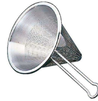
⑬ ROSLE レズレー 18-10 スープ漉し 23218 18cm <BSC-28> 9-0442-1302 ¥6,000