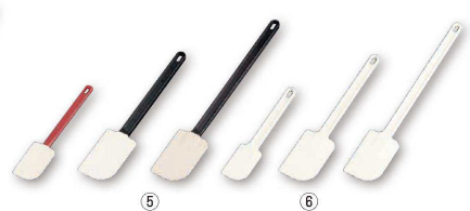
5 マトファ 耐熱スパテラ (BSP-59)

材質:ヘラ部 シリコンゴム(耐熱130℃) ●ハンドル部にスベリ止めが付いているので作業時の手の疲れを軽減できます。