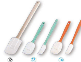
12 シリコン製 ハンドクリーナー 特大 (WHV-16) 9-0448-1201 ¥2,600