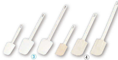
3 スコップ型スクレイパー (一体成型) (WSK-16)