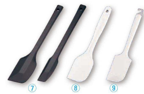
7 シリコンスクレーパー ブラック (BSL-60)