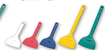
21 シリコン サラクリーナー (一体成型66ナイロン芯入) (BSL-49) ¥2,350