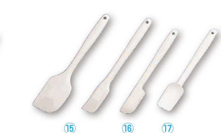
15 ウィズ シリコンゴムヘラ (BSL-33)