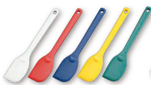
20 シリコンクリーナー (一体成型66ナイロン芯入) (BSL-40) ¥1,800