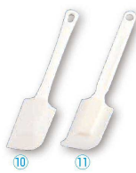
10 ケーキクリーナー (大) ELタイプ DL-6291 (WKL-33)