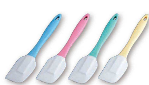
19 シリコン カラークリーナー (BKL-69) ¥1,450