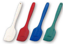
18 シリコンクリーンヘラ (小) (ニュークリーンヘラ小) (WKL-17)