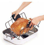
出来上がりを持ち上げてお皿へ。