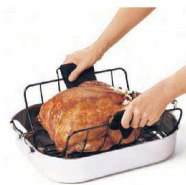
ロースティングラックをセットしてオープンへ

〈BLC-H9〉 9-0483-1101 ¥5,730 324×375×H184 材質:本体/高炭素鋼ワイヤー、ピン/シリコン樹脂 耐熱温度:230℃ ●ローストチキンなどを手を汚さずそのまま持ち運びができます。 ●取り外しのできるピンで、ラックが外れますのでお皿の上に簡単にのせる事ができます。