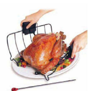
ピンは取り外せます。お皿の上で形を崩さずのせられます。