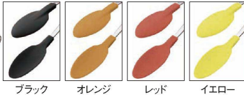
ブラック オレンジ レッド イエロー