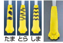
たま とら しま