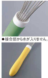
●接合部から水が入りません。