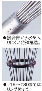
●接合部から水が入りにくい特殊構造。