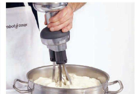
ホイップクリーム