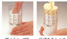
筒からカップを離す

材質: 本体/ポリエチレン樹脂 筒/AS樹脂 ●一目でわかるすっきりしたデザイン。何を計ってもすりきり一杯、一番正確で使いやすい。お菓子作りには欠かせません。 ※イメージ写真の目盛は黒ですが現品はすべて赤です。