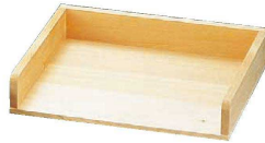
② 木製 チリトリ型作り板 (サワラ材) (BTK-01) 9-0534-0201 大 390×320×H70 ¥6,100 9-0534-0202 小 360×300×H60 ¥5,100