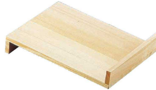
③ 木製 関西型作り板 (BTK-02) 9-0534-0301 ¥5,400

9-0534-0201 大 390×320×H70 ¥6,100 9-0534-0202 小 360×300×H60 ¥5,100