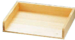
② 木製 チリトリ型作り板 (サワラ材) (BTK-01)

9-0534-0101 大 420×290×H60 ¥5,700 9-0534-0102 小 360×240×H50 ¥4,500