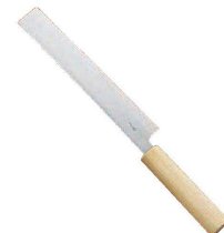
⑦ 雪藤 附庖丁 (AYK-31) cm 9-0534-0701 15 ¥9,400 9-0534-0704 24 ¥16,500 9-0534-0702 18 ¥13,500 9-0534-0705 27 ¥20,500 9-0534-0703 21 ¥14,500 9-0534-0706 30 ¥25,000 ※ 蒲鉾を板に付ける庖丁で、刃は付いていません。