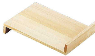
③ 木製 関西型作り板 (BTK-02) 9-0534-0301 ¥5,400 420×295×H60