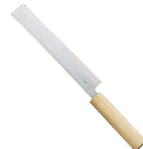
⑦ 雪藤 附庖丁 (AYK-31)

cm cm cm ¥ 9-0534-0601 21 210×210 ¥10,000 9-0534-0602 24 240×240 ¥11,000 9-0534-0603 27 270×270 ¥11,500