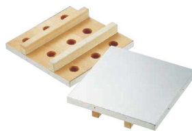
⑥ 木製 付け板 (18-8 ステンレス張り) (BTK-04) cm 9-0534-0601 21 210×210 ¥10,000 9-0534-0602 24 240×240 ¥11,000 9-0534-0603 27 270×270 ¥11,500