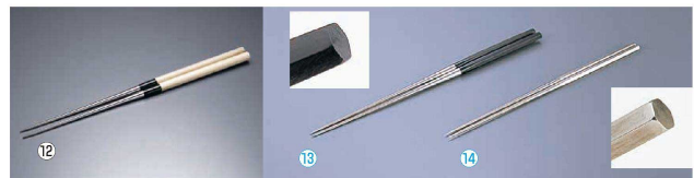
⑫ 本焼ステンレス朴柄盛箸 (BML-22) mm 全長 g 9-0534-1201 120 260 49 ¥6,450 9-0534-1205 180 320 65 ¥7,100 9-0534-1202 135 275 56 ¥6,550 9-0534-1206 210 350 71 ¥7,600 9-0534-1203 150 290 59 ¥6,670 9-0534-1207 240 380 83 ¥8,050 9-0534-1204 165 305 62 ¥6,850

● 焼入れ、焼戻しを行っているので曲がりにくく強度にも優れています。 ※ 質量は1~2g誤差があります。