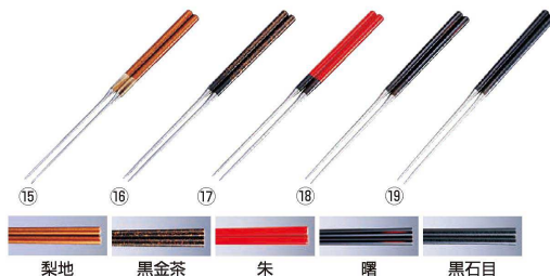
⑮ 梨地 ⑯ 黒金茶 ⑰ 朱 ⑱ 曙 ⑲ 黒石目