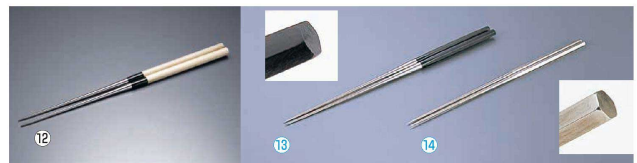
⑫ 本焼ステンレス朴柄盛箸 (BML-22)

mm 全長 g ¥ 9-0534-1201 120 260 49 ¥6,450 9-0534-1202 135 275 56 ¥6,550 9-0534-1203 150 290 59 ¥6,670 9-0534-1204 165 305 62 ¥6,850 9-0534-1205 180 320 65 ¥7,100 9-0534-1206 210 350 71 ¥7,600 9-0534-1207 240 380 83 ¥8,050