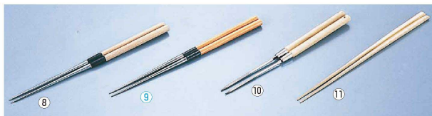
⑧ 極上白木柄 盛箸(水牛桂柄付) (BML-01)

cm cm cm ¥ 9-0534-0701 15 ¥9,400 9-0534-0702 18 ¥13,500 9-0534-0703 21 ¥14,500 9-0534-0704 24 ¥16,500 9-0534-0705 27 ¥20,500 9-0534-0706 30 ¥25,000 ※ 薄鋒を板に付ける庖丁で、刃は付いていません。