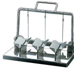
2 3連玉子カッター 縦割 〈BTM-22〉 9-0571-0201 ¥57,000 248×173×H67 質量:約1.25kg 材質:ステンレス ●替ワイヤー1セット付(3本)。