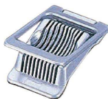
7 ウエストマーク エッグスライサー 1020 〈BUJ-47〉 9-0571-0701 ¥4,570 127×82 材質:アルミダイカスト