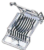
8 18-0 ピアノ線 玉子切 〈BTM-10〉 9-0571-0801 ¥660 140×85