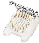
9 PP ピアノ線 玉子切 〈BTM-11〉 9-0571-0901 ¥250 100×85(耐熱70℃)