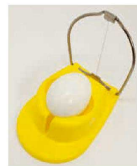
4 玉子半ぶんこ 〈BTM-43〉 9-0571-0401 ¥640 120×85 材質:本体/ポリプロピレン(耐熱120℃) 線材/ステンレス