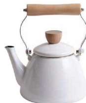
⑥ ケトル 2.2ℓ ホワイト <EKT-75> 外径 口径 高さ 底径 9-0064-0601 220 105 175 180 ¥4,000 材質：蓋つまみ・取手/天然木