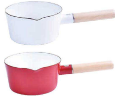
③ ミルクパン15cm <ANB-45> ¥2,500 9-0064-0301 ホワイト 9-0064-0302 レッド 内径 高さ ℓ kg 底径 147 78 1.2 0.44 130 材質：取手/天然木 ※コンパクトサイズのため、IH反応サイズ・コンロ形状をお確かめ下さい。