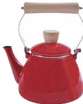
⑤ ケトル 1.4ℓ レッド <EKT-74> 外径 口径 高さ 底径 9-0064-0501 190 90 150 140 ¥3,500 材質：蓋つまみ・取手/天然木