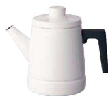
⑬ ソリッド コーヒーポット 1.6ℓ SD-1.6CP <ASL-71> ¥4,500 9-0064-1302 W 白 外径 高さ 底径 135 190 120