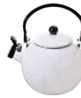
⑦ 笛吹ケトル 2.2ℓ ホワイト <EKT-76> 外径 口径 高さ 底径 9-0064-0701 220 105 180 180 ¥5,400 材質：蓋つまみ・取手/ベークライト ●お湯が沸いたら、ピーッとお知らせ。