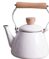
④ ケトル 1.4ℓ ホワイト <AYK-91> 外径 口径 高さ 底径 9-0064-0401 190 90 150 140 ¥3,500 材質：蓋つまみ・取手/天然木