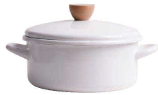
① 両手鍋 20cm <ANB-40> 内径 深さ ℓ kg 底径 9-0064-0101 205 95 2.7 1.35 185 ¥4,300 材質：蓋つまみ/天然木

コーギークック ホーローシリーズ 保温性が高く、IHでもガスでもコンロを選ばず使えます。