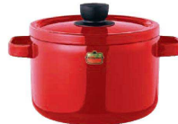
⑨ ソリッド ディープキャセロール 22cm SD-22DW <ASL-73> ¥6,000 9-0064-0901 R 赤 内径 深さ ℓ kg 底径 220 154 5.6 1.76 175