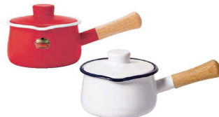
⑫ ソリッド ミルクパン 15cm SD-15M <ASL-88> ¥4,000 9-0064-1201 R 赤 9-0064-1202 W 白 内径 深さ ℓ kg 底径 150 84 1.2 0.76 125