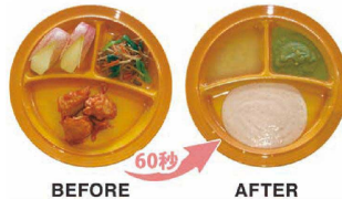
BEFORE AFTER 60秒