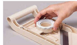
厚さ調節ダイヤル