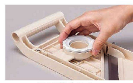
厚さ調節ダイヤル